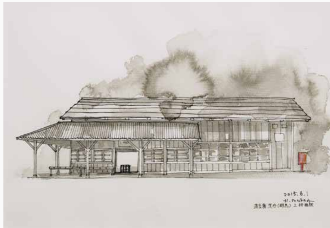
静かなる時間 (渡良瀬鉄道) 255×370 mm