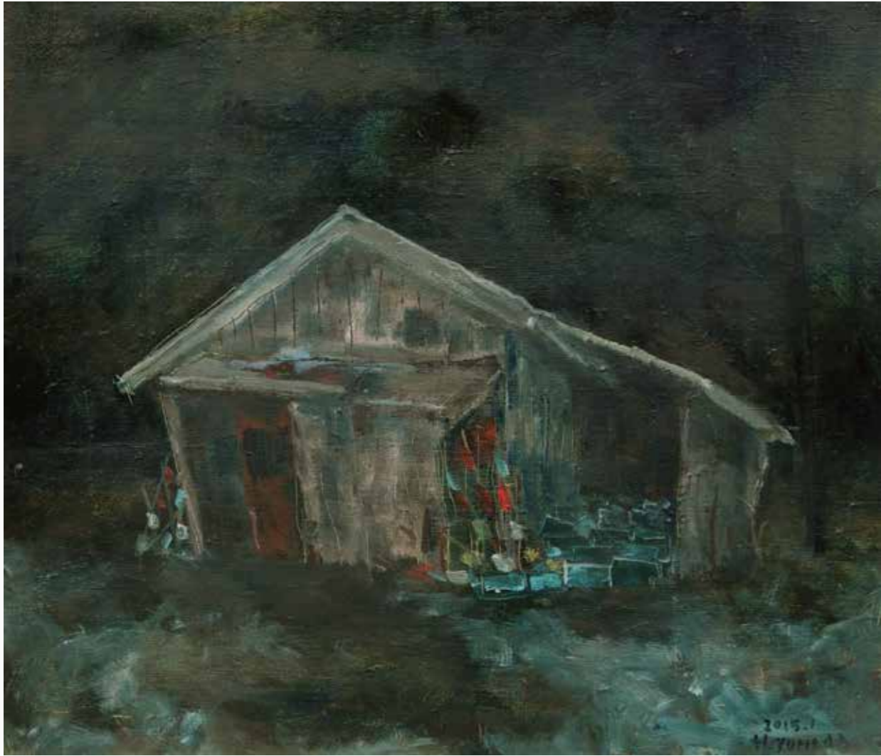
漁具小屋 (朝日町) 455×530 mm