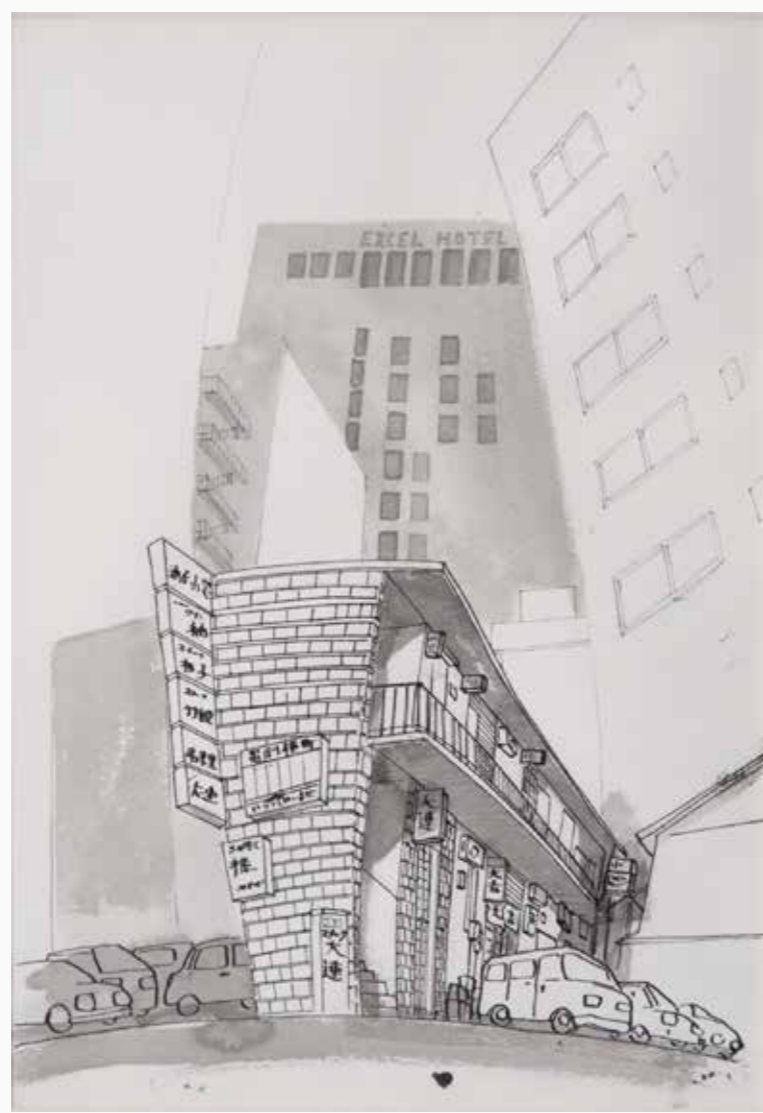
雑居ビル (旧富劇周辺) 370×260 mm