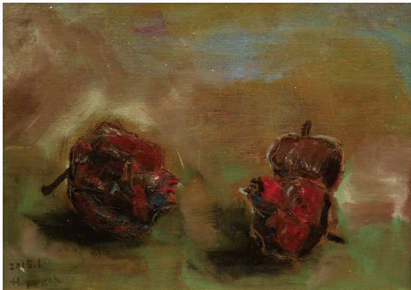
ざくろ 220×333 mm