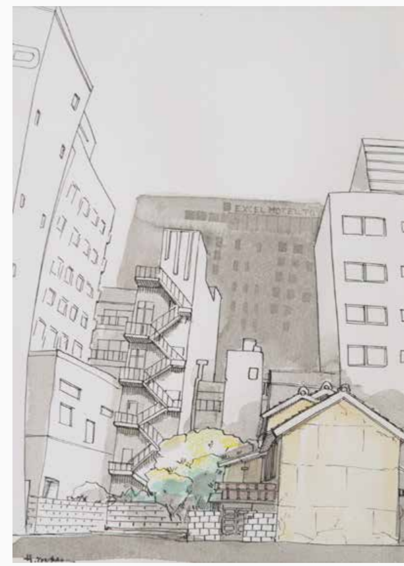
ビルの狭間 (旧源宅) 350×250 mm