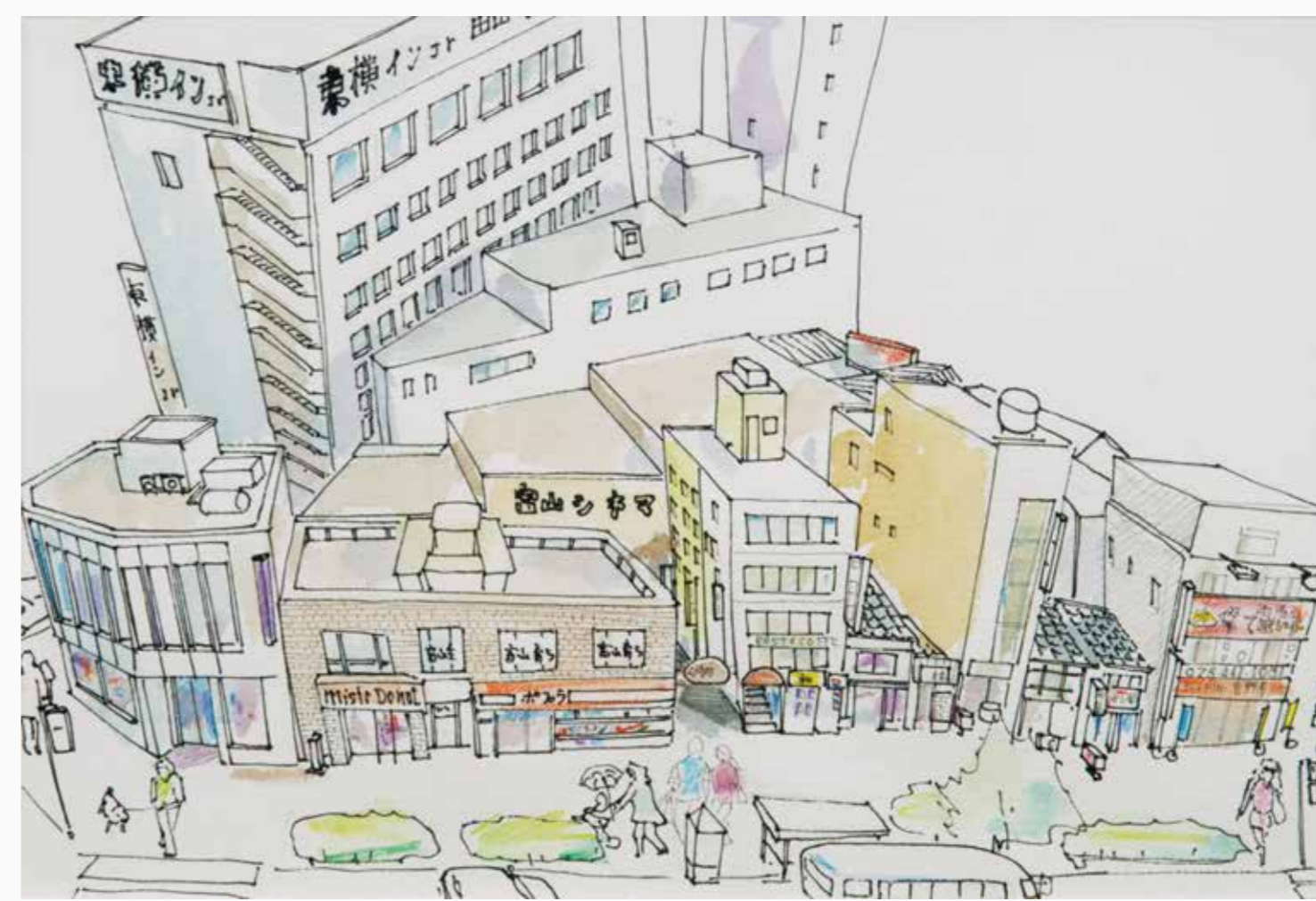
消えた昭和 (旧駅前シネマ街) 240×355 mm