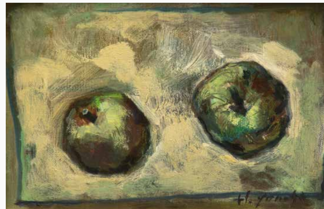
一息(青りんご) 255×370 mm