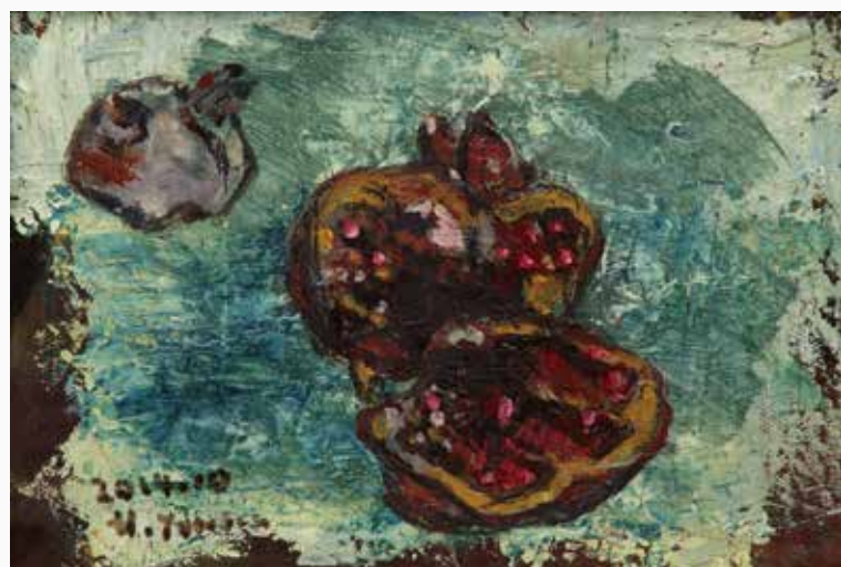
一息(ざくろ) 160×220 mm