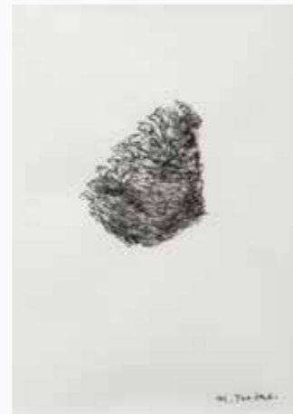
ぼっくり 160×110 mm