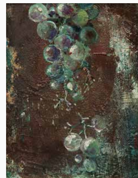
一息(ぶどう) 190×140 mm