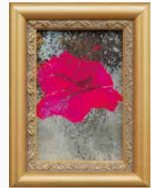
ハイビッカス 70×45 mm