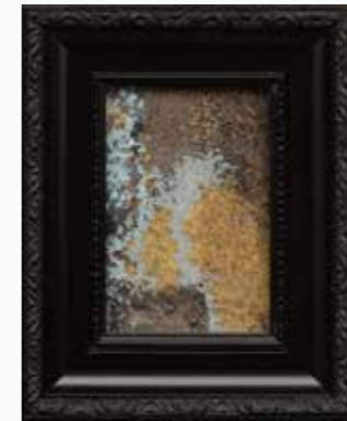
水の森 75×45 mm