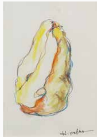
食べごろ (洋梨) 160×110 mm