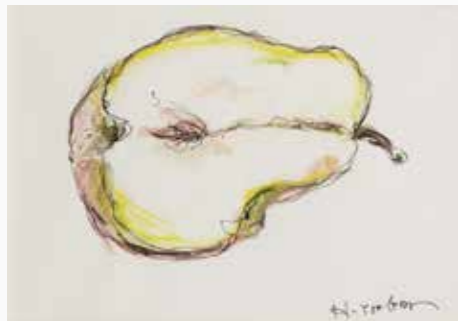
食べごろ (洋梨) 110×160 mm