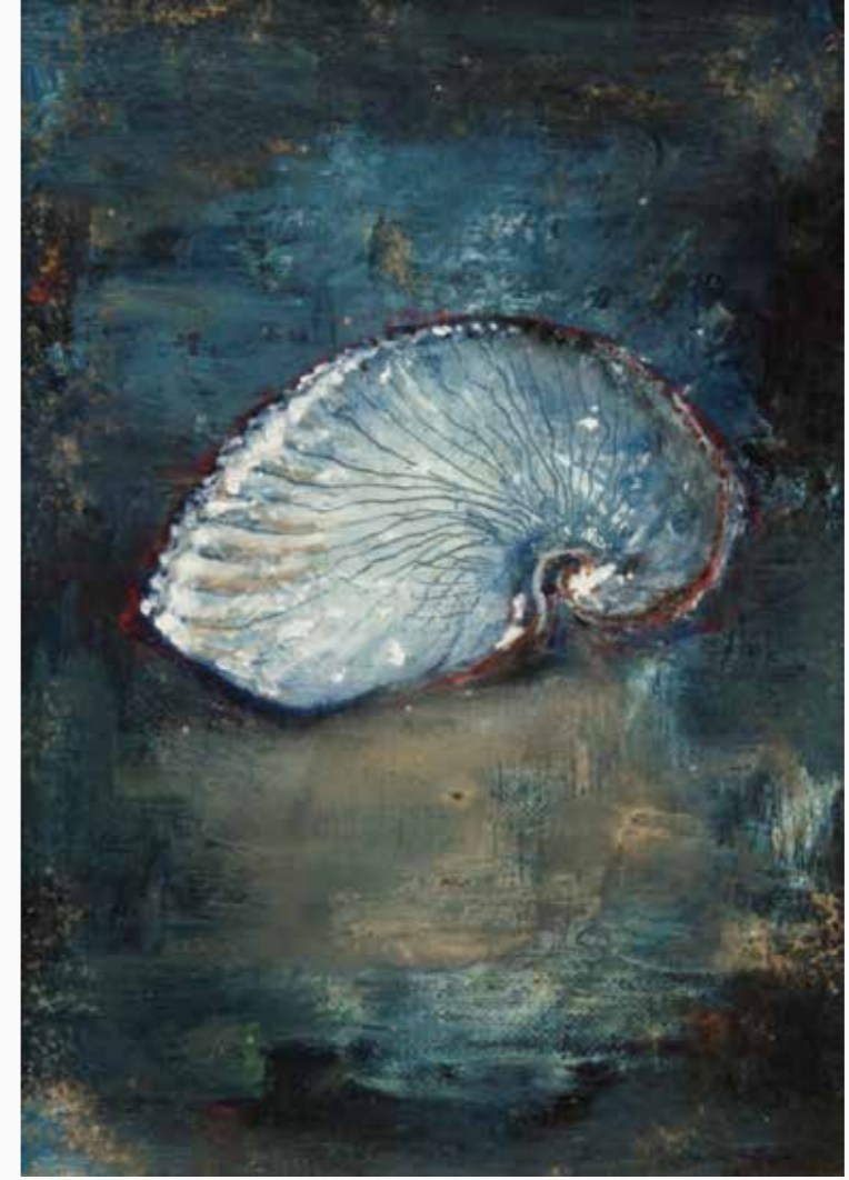
黙 227×158 mm