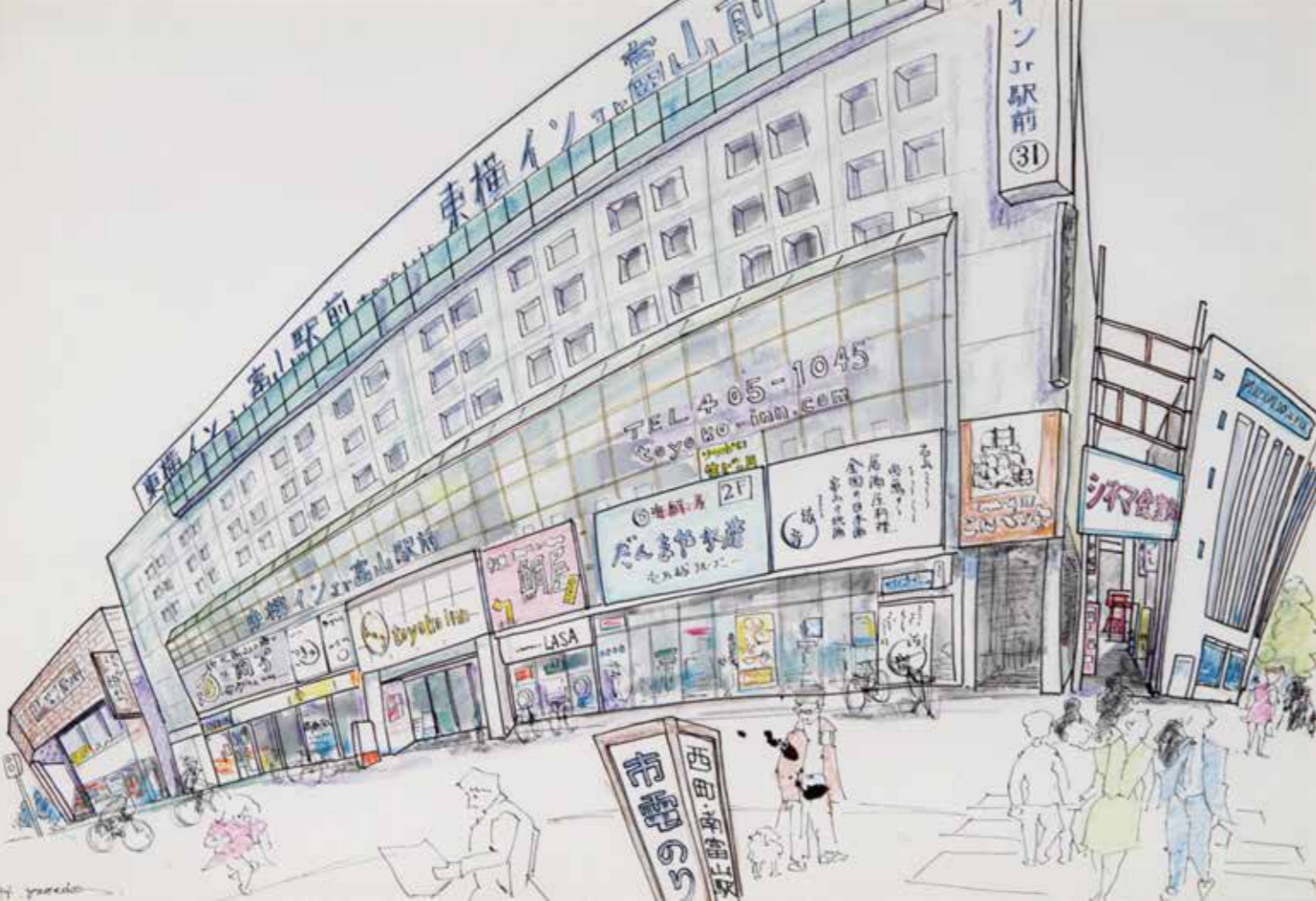
消えた昭和 (駅前シネマ) 350×520 mm